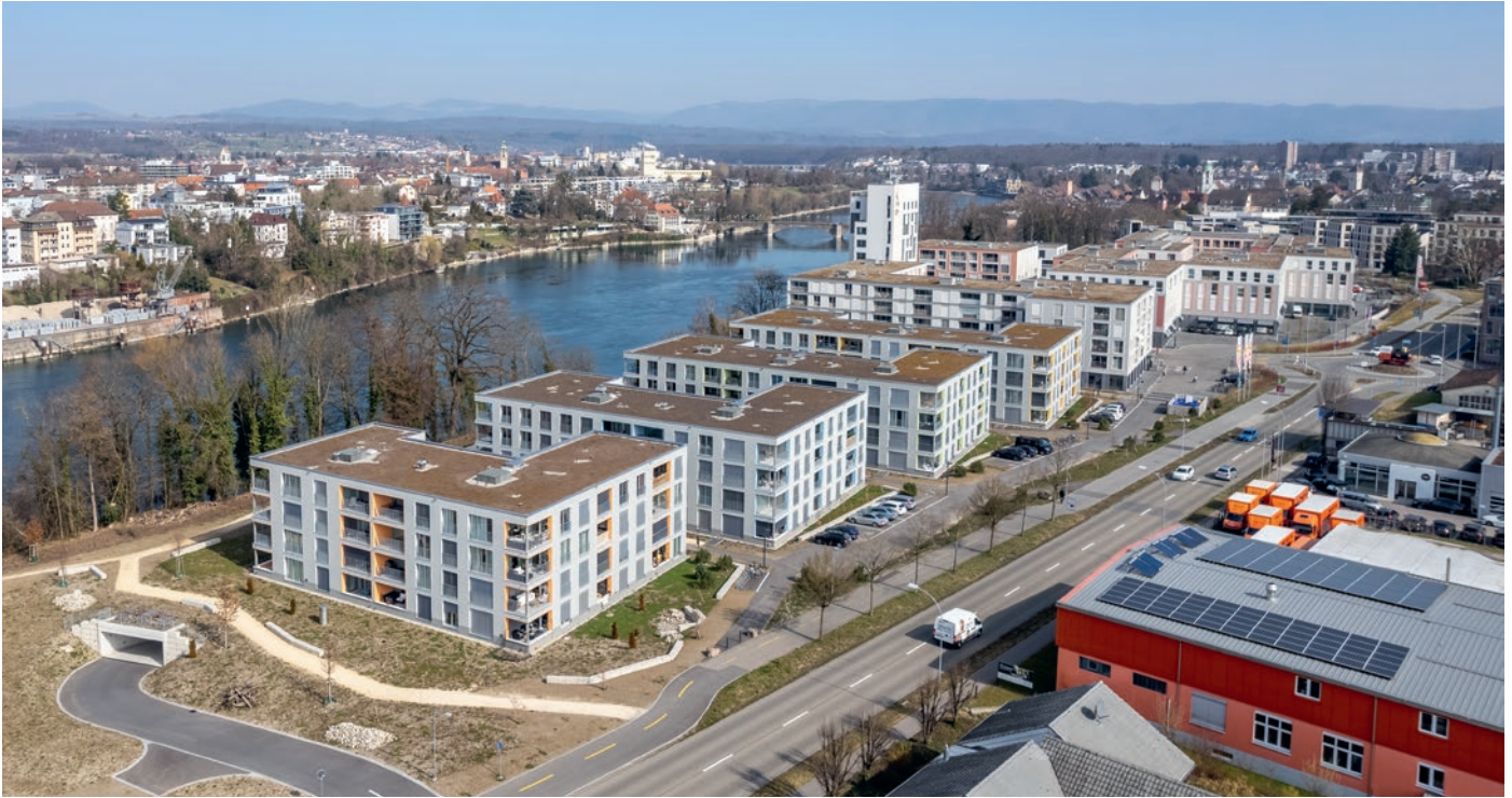
In der Wohnüberbauung «Rhyvage» sind 40 der total 132 Wohnungen altersgerecht gebaut.