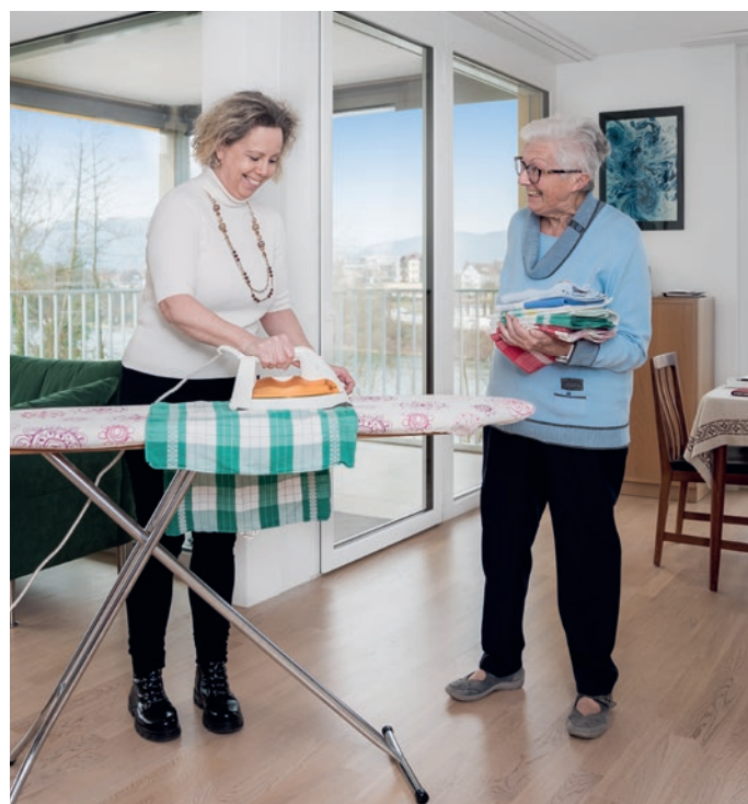
Beliebter Service: helfende Hände im Haushalt.

Bereits in den ersten Wochen durfte ich diverse Beratungen zu den Living Services und dem Notrufservice von bonacasa tätigen, welche ein grosses Interesse wecken. Der Beginn einer Ansiedlung ist ein Prozess, bei dem die Bewohnerschaft vernetzt werden und das Vertrauen zur Concierge und innerhalb der Siedlung aufgebaut werden muss. Bewohnerinnen und Bewohner, welche ihr Interesse am Notrufservice von bonacasa anfänglich zurückhaltend bekundet hatten, kamen zu einem späteren Zeitpunkt auf mich zurück, um die Beratungsdienstleistung in Anspruch zu nehmen. ■